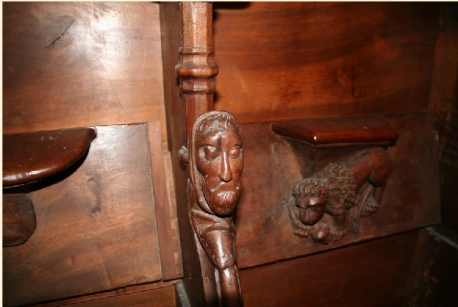
Kálvin kedvelt széke